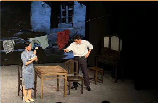
编者按：戏剧是一面镜子，是一场梦境，是一扇窗户。是人类情感、想象力和创造力的表现。我们在戏剧中看到自己，也在戏剧中穿越时空、对话世界。接下来就让我们一起回顾与戏剧相伴的日子，重新审视那作为观众和剧中人的我们。